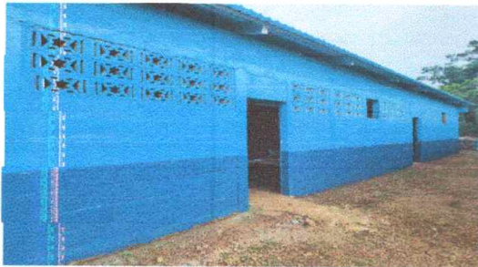
Foto 3: Culminación de la estructura metálica y la pintada del exterior e interior de la escuela del módulo 3